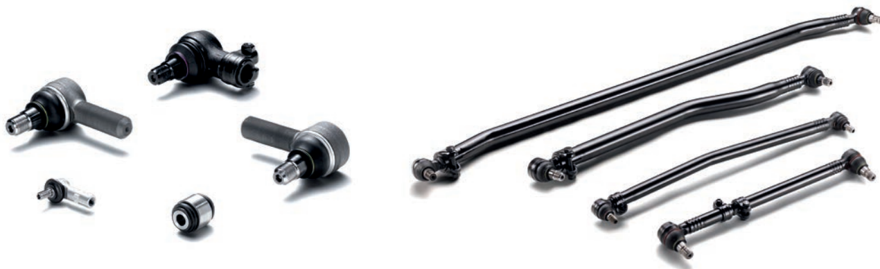
Рулевые наконечники MAN от 10 024 руб. с НДС