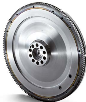
Маховики MAN от 27 554 руб. с НДС