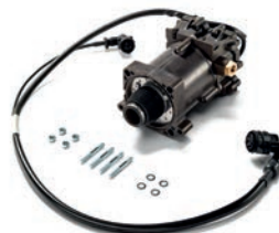
Главные цилиндры сцепления MAN от 9 075 руб. с НДС