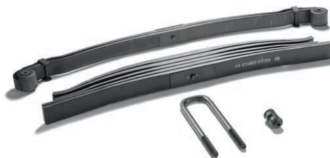
Листовые рессоры MAN от 29 259 руб. с НДС