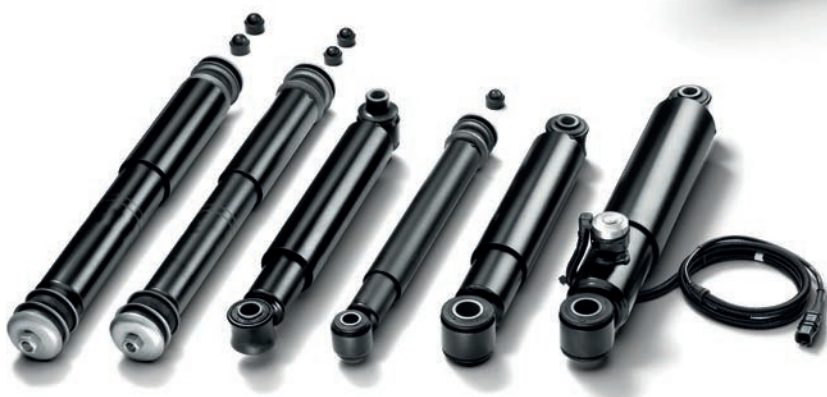
Амортизаторы MAN от 13 435 руб. с НДС