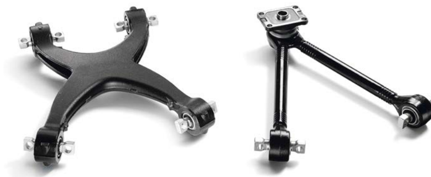
Треугольные и четырехточечные рычаги подвески MAN от 41 308 руб. с НДС