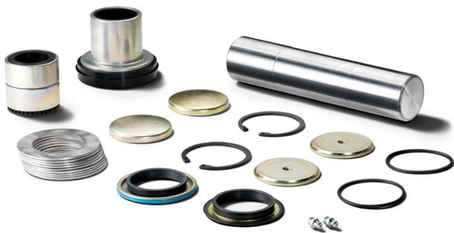
Ремкомплекты для поворотной цапфы MAN от 17 165 руб. с НДС