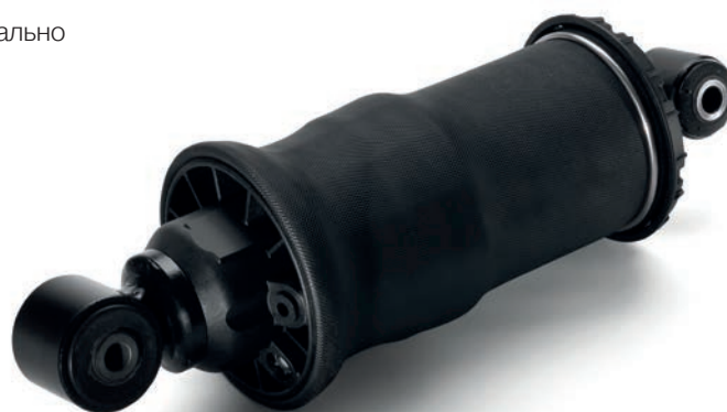
Пневмобаллоны MAN от 8 142 руб. с НДС